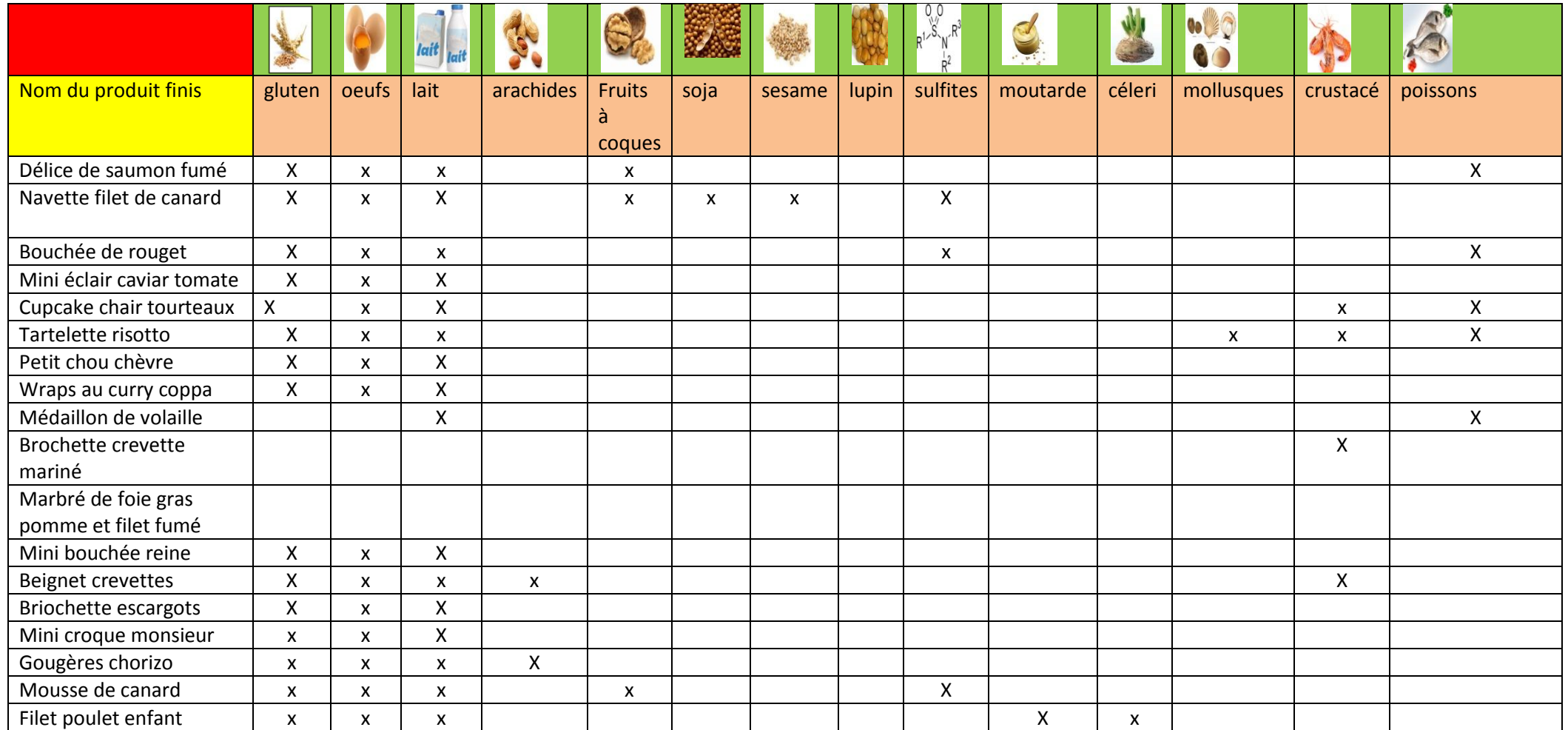
TABLEAU DE PRESENCE DES ALLERGENES